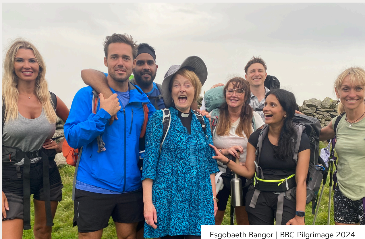
Esgobaeth Bangor | BBC Pilgrimage 2024

Rydym yn eich croesawu i ymuno â ni yn y genhadaeth drawsnewidiol hon, wrth i ni wneud ein ffordd trwy heriau ein hamser gyda ffydd, ymroddiad, ac ymrwymiad i addoli, twf a chariad.